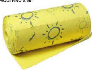
Pannospugna Quick'n Dry cod. 89437 - 25cmx10mt

RIUTILIZZABILE, SOPPORTA I LAVAGGI FINO A 95°