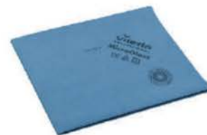
Panno MicroGlass - in microfibra. cod. 82601 - 50x40cm - pack 5pz