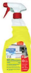
Disinfettante Multi Activ Limone cod.90402 - 750ml