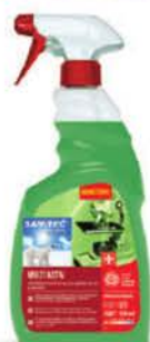
Disinfettante Multi Activ cod.82744 - 750ml